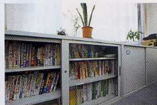
システム開発に必要な技術書は、事務所奥の開発室に整理した。

事務所移転のための経費をできるだけ削減するために、OA家具の一部をリサイクルショップで仕入れた。富山県下にあるショップを探して、本棚やポットを置くためのOA家具などを市価の20~30%の価格で購入した。事務所移転のためにかかった費用はおよそ70万円だったが、当初予想していた経費よりも随分と安価に抑えることができた。