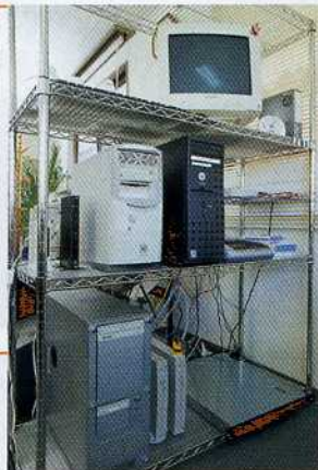
PC、周辺機器、サーバーが設置してある棚は開発室向きに配置。

コン教室のスペースとして利用している。また事務所の立地が海沿いで周辺に高いビルもなく隙間風が寒いため、社員全員に電気膝掛けを支給するなどの心遣いも。開発スペースでは周囲の雑音も気にかからず、仕事のはかどり具合は良好。